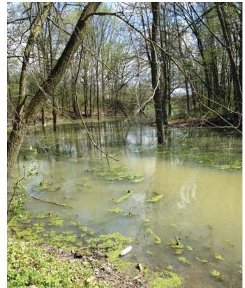
Marécage riverain au parc Les Salines