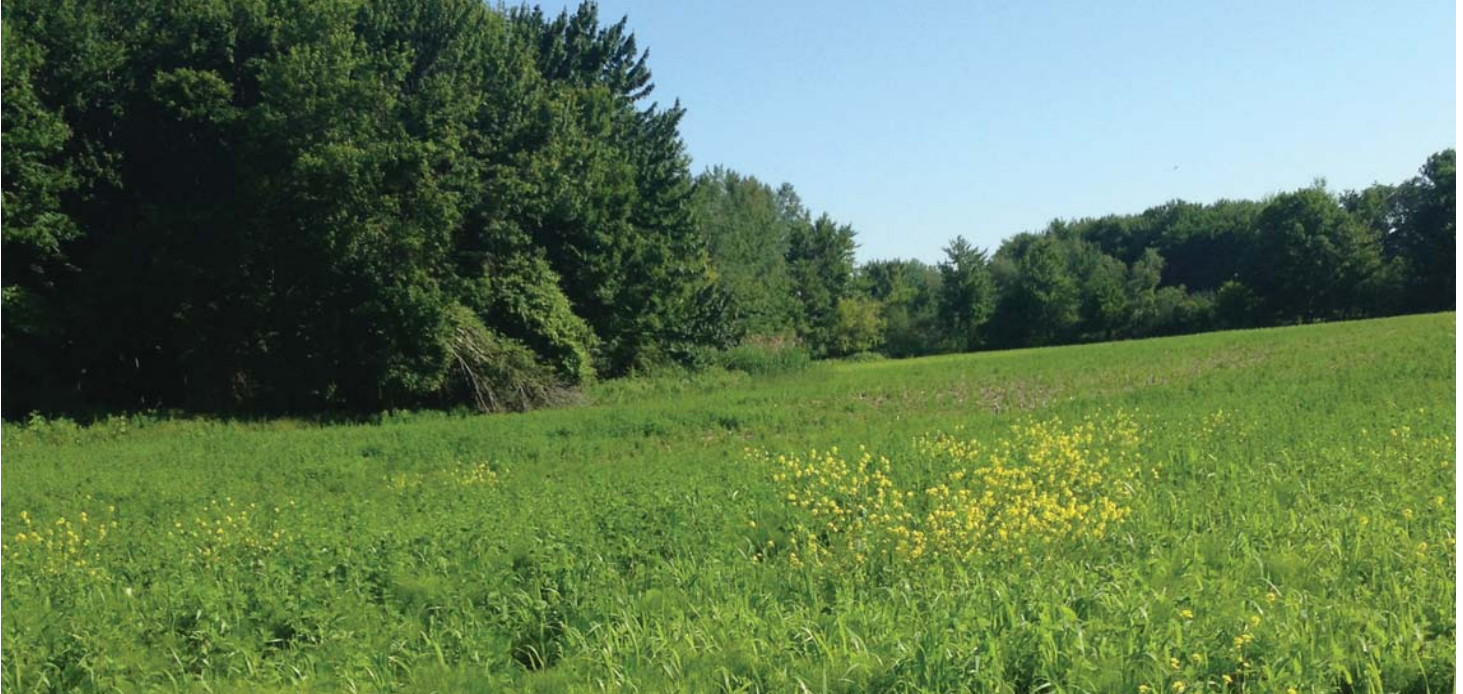
Pré bordé de forêt

Les fourrages, les prairies d'herbe et les pâturages sont des habitats prisés par plusieurs espèces d'oiseaux champêtres, dont le bruant des prés, l'hirondelle rustique, le goglu des prés, la crécerelle d'Amérique et le tyran tritri. Ces milieux ouverts fournissent des aires de reproduction et d'alimentation qui permettent d'assurer la survie des populations d'oiseaux champêtres. À l'heure actuelle, 61% des espèces d'oiseaux champêtres sont significativement en déclin