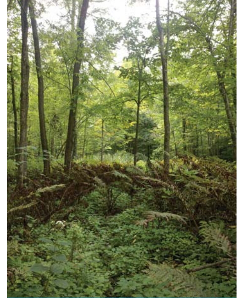
Marécage à la Crête de Saint-Dominique

La rainette crucifère est une toute petite grenouille grimpeuse dont les doigts sont pourvus de ventouses. Elle vit dans des milieux variés tels que les friches, la forêt et les milieux humides. Comme la grenouille des bois , elle dépend d'un habitat aquatique temporaire ou permanent pour se reproduire. La détérioration et la destruction des milieux humides affectent donc grandement les populations de ces espèces. La rainette crucifère a d'ailleurs déjà disparu de certains sites du territoire.