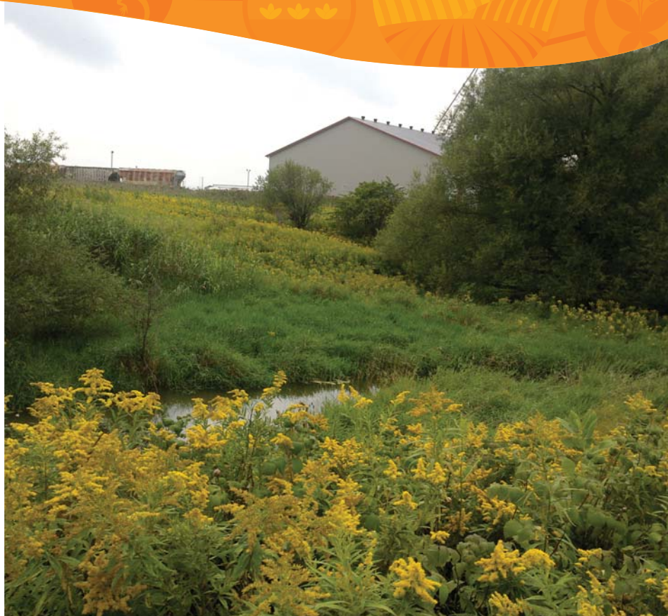
Friche en fleurs

Les milieux ouverts de Saint-Hyacinthe offrent également des habitats pour le majestueux monarque qui est connu pour sa migration annuelle impressionnante de plus de 4 000 km. Le déclin de cette