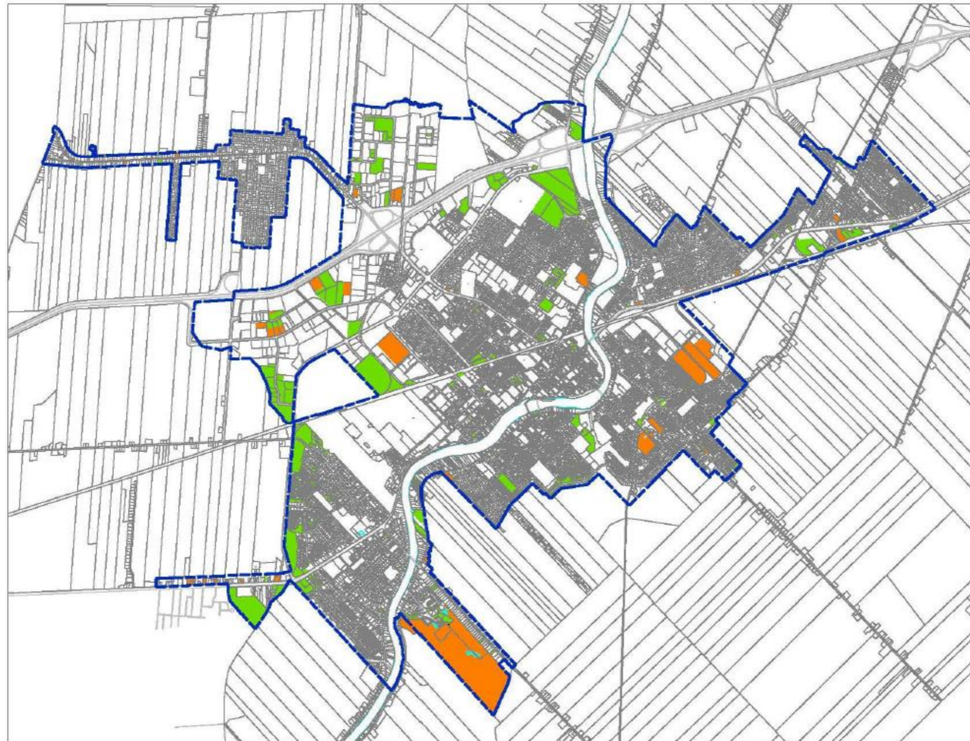
Plan 5.1 – Terrains vacants et à requalifier (349-12 : AM : 2022-11-07, EV : 2022-12-21)